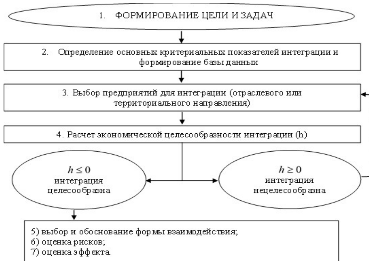
Рисунок 3 — Алгоритм стратегической оценки интеграции малого, среднего и крупного предпринимательства

Второй этап направлен на определение основных критериальных показателей интеграции, среди таких показателей могут быть: объем реализованной продукции, инвестиции в основной капитал, доля рынка, численность работников, доля транзакционных издержек и пр.