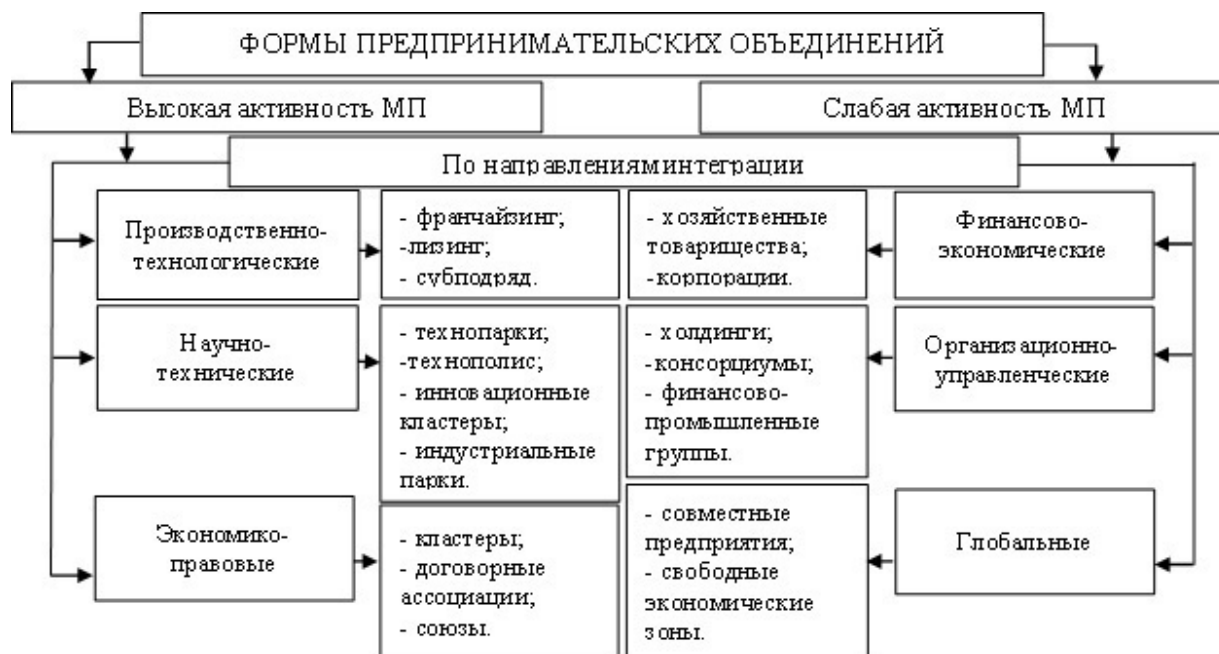
Рисунок 1 — Формы предпринимательских объединений по направлениям интеграции

Учитывая вышесказанное, считаем целесообразным отразить процесс формирования интеграционной модели предпринимательских объединений как совокупности возможных форм взаимодействия малого, среднего и крупного предпринимательства, а также направлений интеграции с учетом уровня активности малого бизнеса (рис. 1).