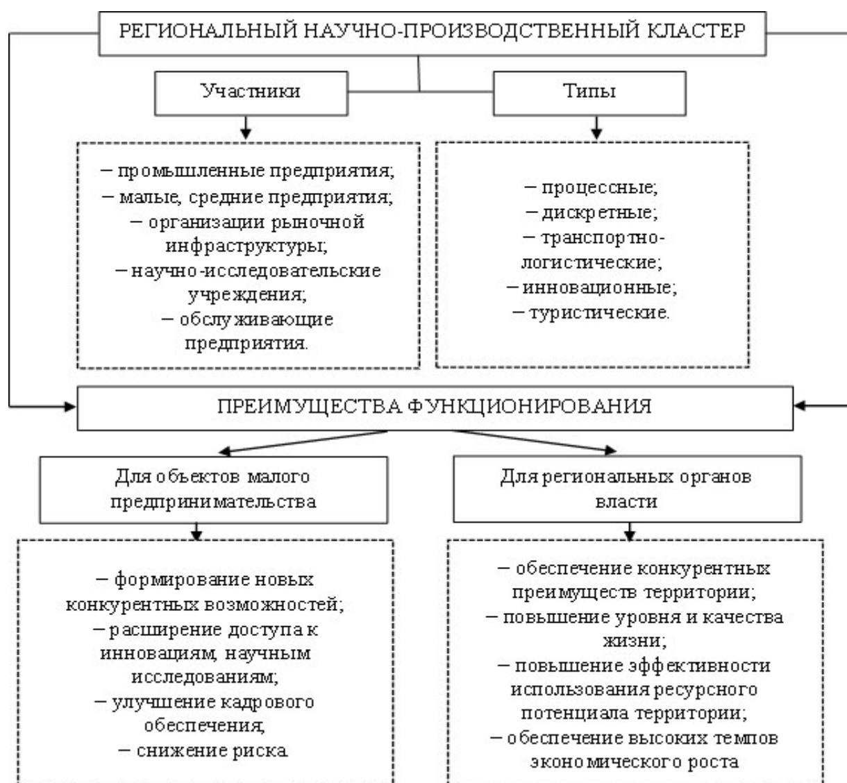
Рисунок 2 — Концептуальные основы функционирования кластера в экономической системе региона

Первый этап предложенного алгоритма предусматривает определение целей интеграции и формирование задач для их достижения. Для субъектов малого предпринимательства такими целями могут быть следующие: